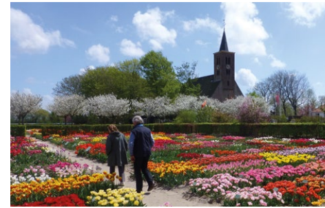
'Limbon' Prot. Kerk en entree Hortus Bulborum

» RA Zuidkerkelaan: Bij Rijksweg LA fietspad naar stoplichten (niet oversteken, rij klein stukje rechtdoor in doodlopend stuk tot op de brug.)