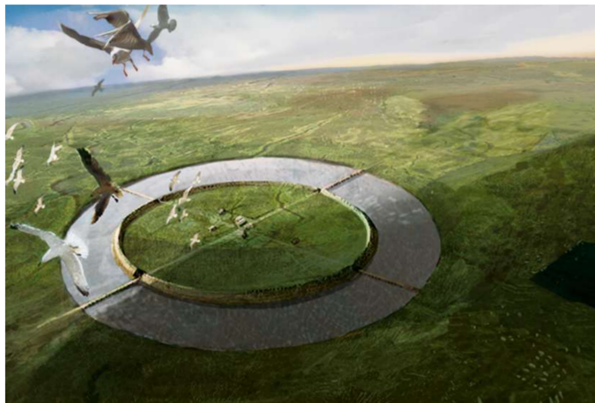
Impressie van een mogelijke ringwalburg in de 9e eeuw in Castricum.

„Toen dacht ik: zou er in Castricum ook een ringwalburg kunnen zijn geweest?”