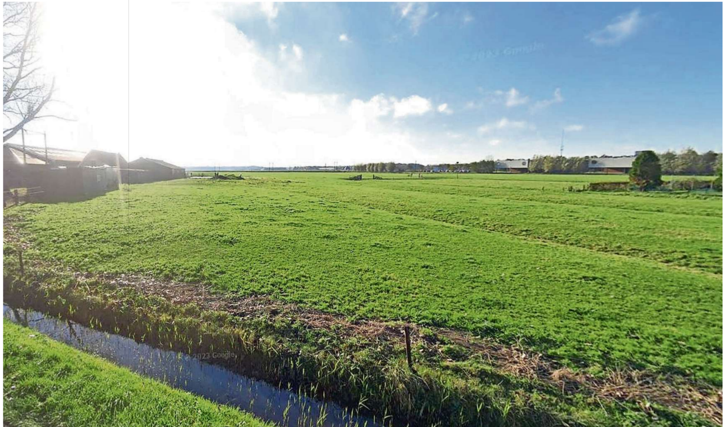
De locatie van kasteel 't Blockhuys,

Op de door hem beredeneerde plek is nog altijd het dorps hart van Castricum, met de kerk, die op een terp ligt. Dat was ook in de vroege middeleeuwen al het centrum. Een deel van de Dorpsstraat werd steeds aangeduid als de 'Dingstal', zegt Van Weenen. „Dat was de plek waar recht werd gesproken en waar de dorpelingen bij elkaar kwamen. Waar ze zich verzamelden om ten strijde te trekken. Het rechthuis