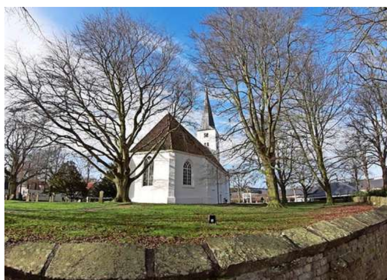
De zeker duizend jaar oude Witte Kerk in Heiloo ligt op een verhoging op de toch al hogere strandwal.

ILLUSTRATIES PRESENTATIE LIA VRIEND/STICHTING OER-IJ