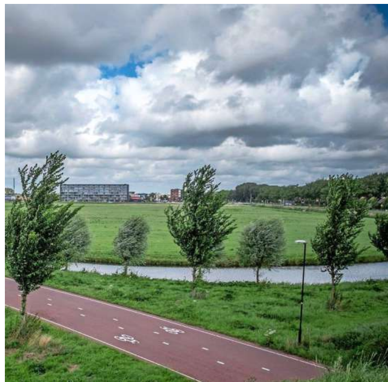
Het gebied Westpoort in Heerhugowaard.

Er is een boekje van de route gemaakt in een oplage van 3000 exemplaren. Dat is gratis verkrijgbaar bij onder andere Herberg Jan, Bibliotheek Heiloo, De Verhalenkamer/VVV, Historisch Museum Heiloo, Stichting Oud Limmen en Huis van Hilde in Castricum.