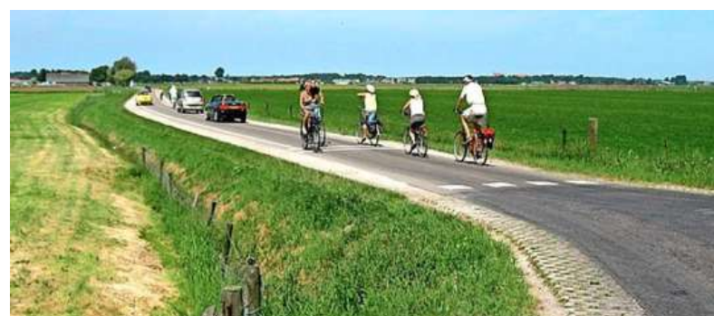
De Zanddijk is in de elfde eeuw door monniken gemaakt tegen het Oer-IJ.

Het bedevaartsoord Onze Lieve Vrouw ter Nood tussen Heiloo en Limmen ligt op de route, evenals het Stet, het oude haventje van Limmen. Daarna leidt de tocht de fietser naar Limbon, de oude buurtschap op de zuidpunt van de strandwal bij Limmen, met als herkenningspunten de oude hervormde kerk, de histori-