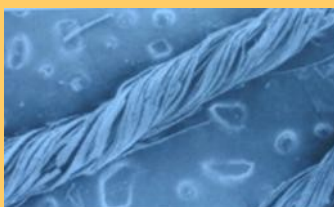
de oudste vlasdraad

andere kant van het Oer-IJ werd veel meer wol geproduceerd. In de Broekpolder werd vlas in zulke grote hoeveelheden aangetroffen dat men van een echte vlasproductie kan spreken. Het vlas werd tot touw verwerkt maar ook de verwerking tot linnen kan niet worden uitgesloten. Linnen is het geweven product van de vlasdraad waarvan kleding kan worden gemaakt. Het voelt aangenaam zacht aan, is uitstekend te verven, gaat jaren mee en draagt erg comfortabel. De naam 'Vlaskamp' is dus niet zomaar gekozen.