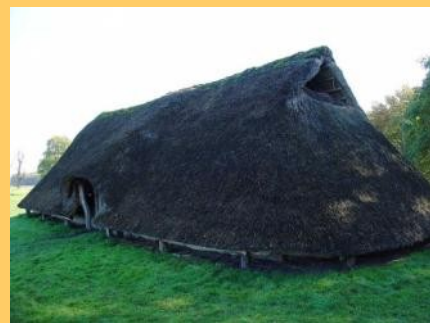
voorbeeld van ijzertijdboerderij

-A- geeft de plek aan waar de resten van een boerderij uit ongeveer 400 voor de jaartelling is gevonden. In totaal zijn er drie van dergelijke woonplattegronden gevonden waarvan twee op de hoeken van het archeologische monument. Een boerderij bestond uit een woon- en een stalgedeelte en was ca. 20 m lang en 6 m breed. De wanden bestonden uit hout, vlechtwerk, plaggen of stro met leem. Het dak was van stro, riet, heide of hout. Er werden koeien, maar ook varkens, schapen, geiten en later ook paarden gehouden. Deze boerderijen gingen in de regel één generatie mee waarna ernaast een nieuwe boerderij werd gebouwd. De resten van die opeenvolgende boerderijen liggen naar verwachting onder het archeologische monument en blijven op die manier bewaard voor ons nageslacht.